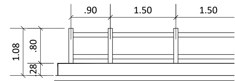
GUARDA - CORPO