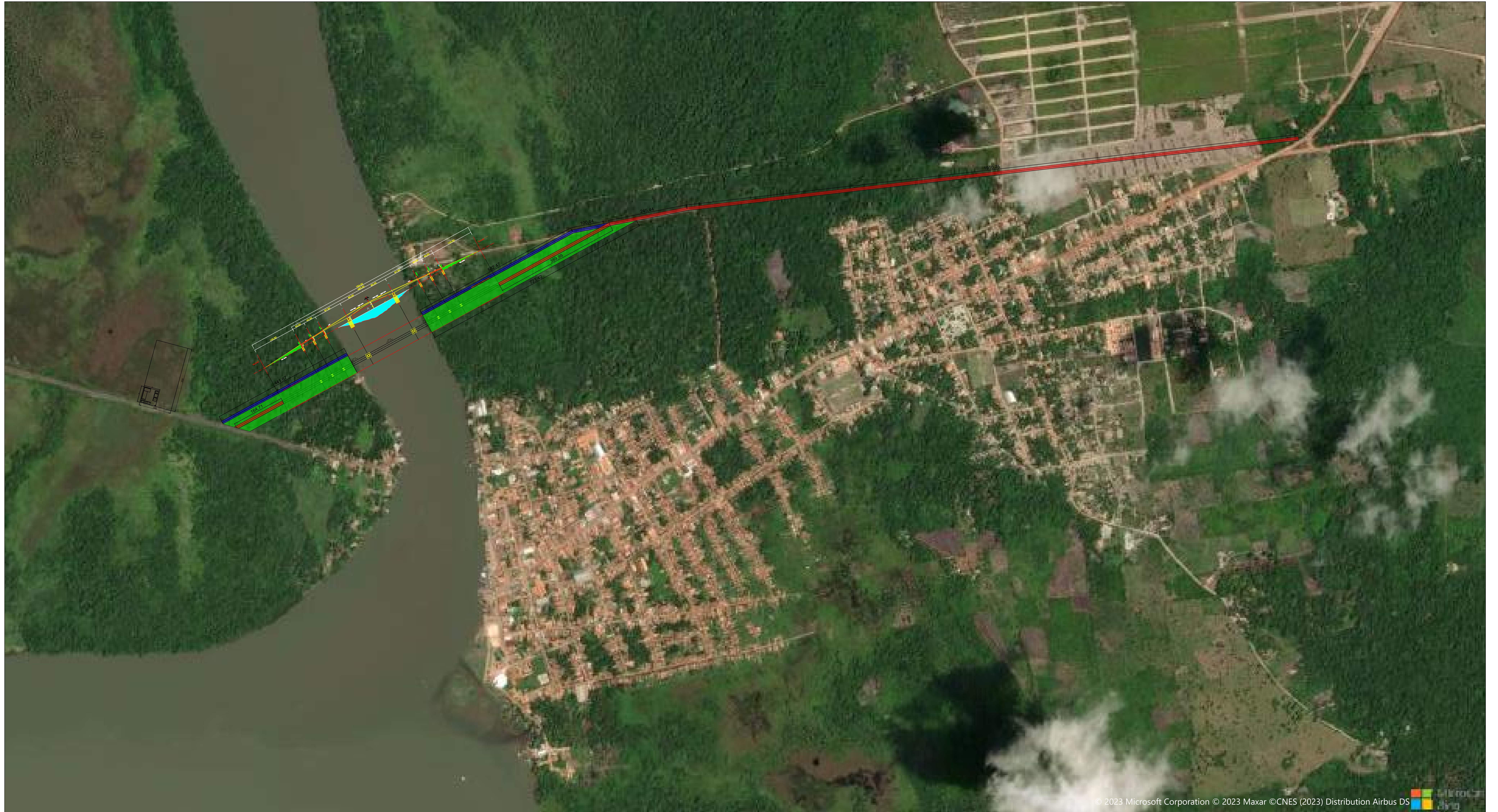
MAPA DE IMPLANTAÇÃO DA OBRA S/ ESCALA