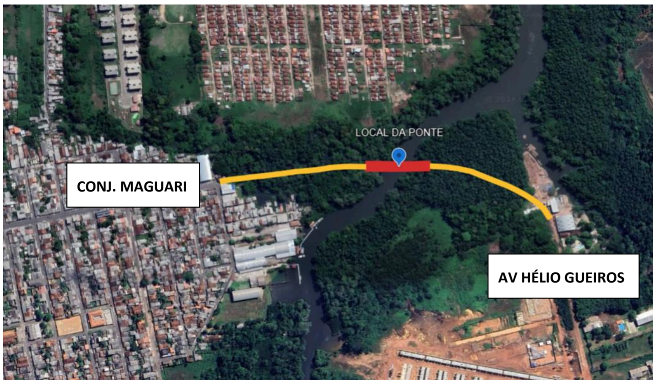
Ponte sobre o Furo do Maguari, 1^{\circ}19'44''S 48^{\circ}25'42''W

A competência de execução do referido objeto ampara-se nos termos do art. 1º da Lei nº 5.834, de 15 de março de 1994, que dispõe sobre a Reorganização e Cria Cargos e Funções na Secretaria de Infraestrutura e Logística - SEINFRA e dão outras providências, esta secretaria “tem por finalidade planejar, coordenar, supervisionar, executar e controlar as ações relativas à Política dos Transportes no Estado do Pará” ;